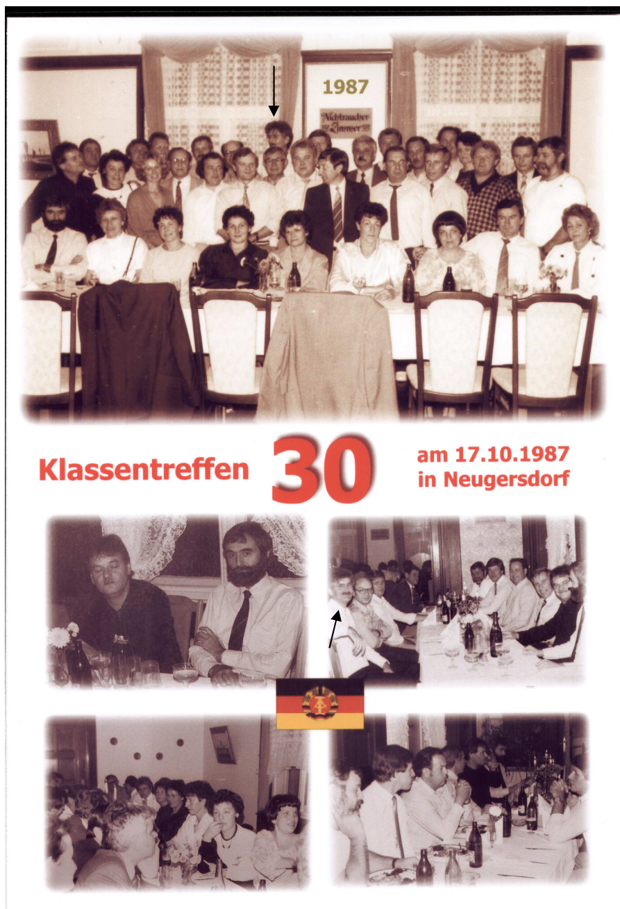
Siehe > 4.5 > Reisen in die DDR > 1987 > 1997 > 2009