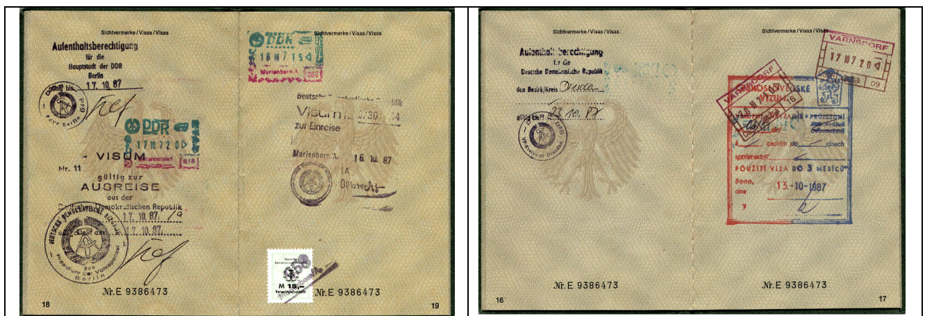
Visum: Einreise in die DDR Berlin am 16.10.1987

Nach einer schönen Reise waren wir froh, die Repressalien der DDR überstanden zu haben.