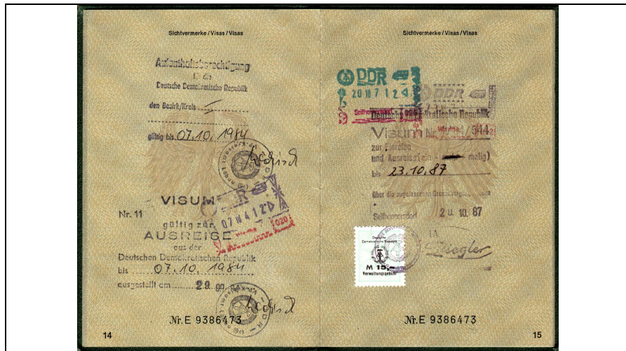
Unten rechts: Visum: Ein- und Ausreise 20-23.10.1987