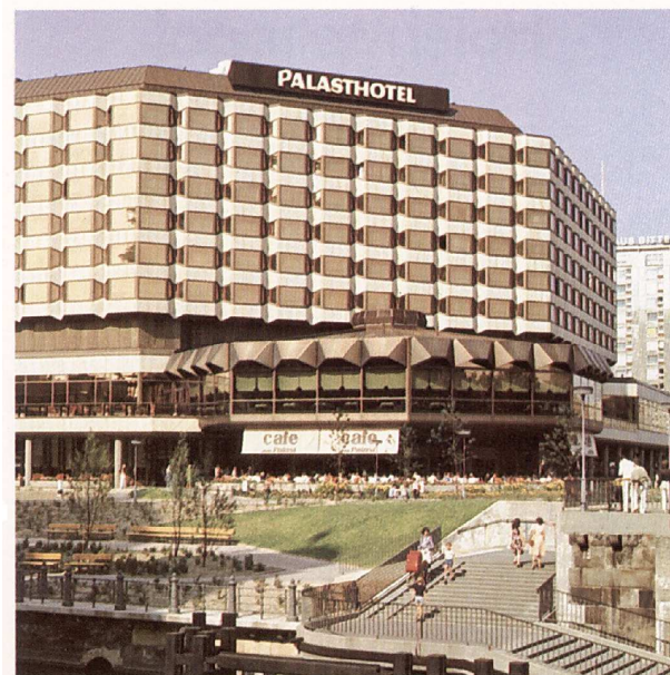
Palasthotel wurde nach 2000 abgerissen.