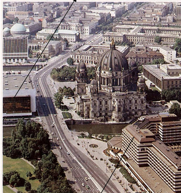
Berliner Stadtpanorama (1985)

Palast der Republik (Volkskammer der Republik) wurde nach 2000 abgebrochen.